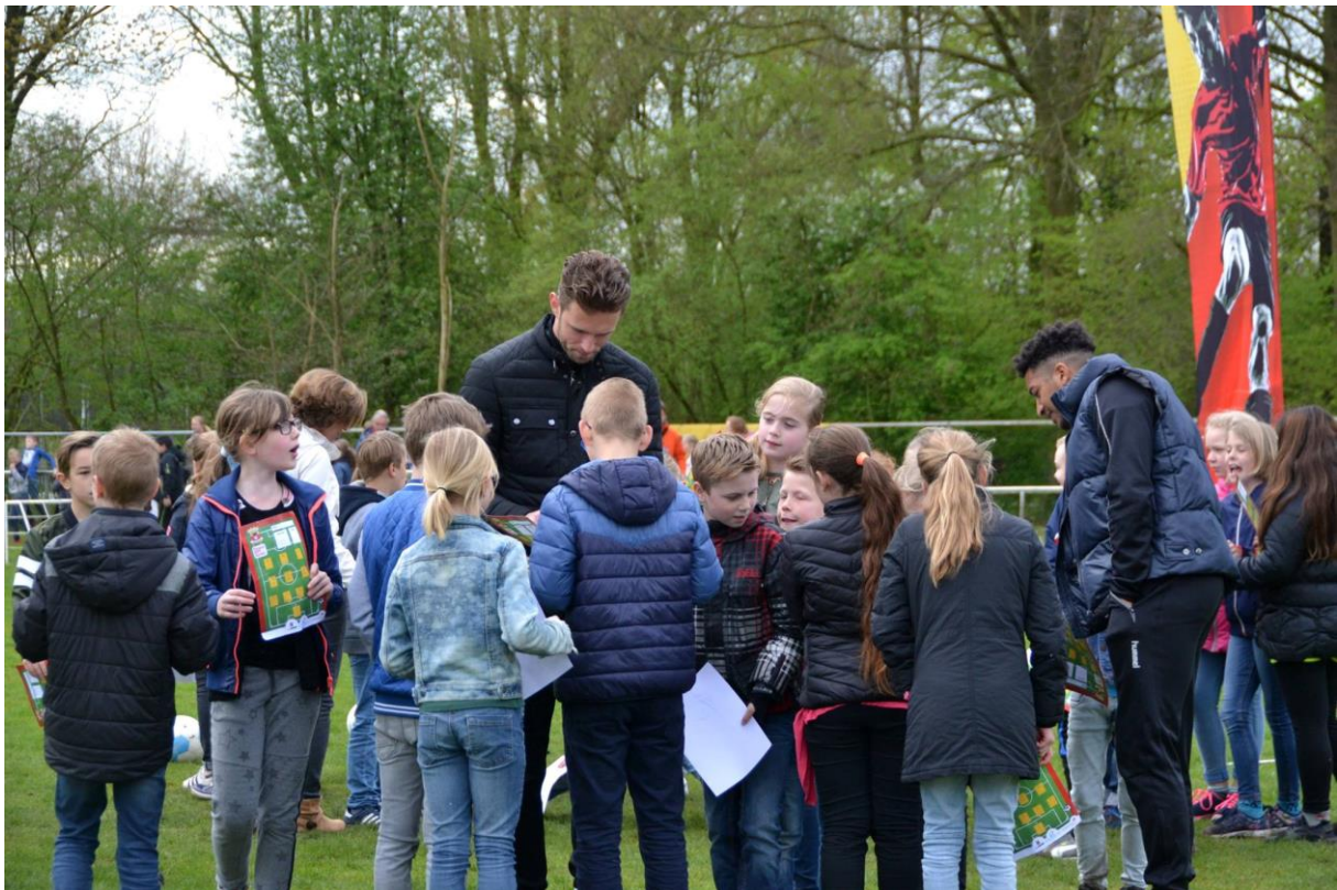
Scoor een boek, jaarlijks project samen met Go Ahead Eagles