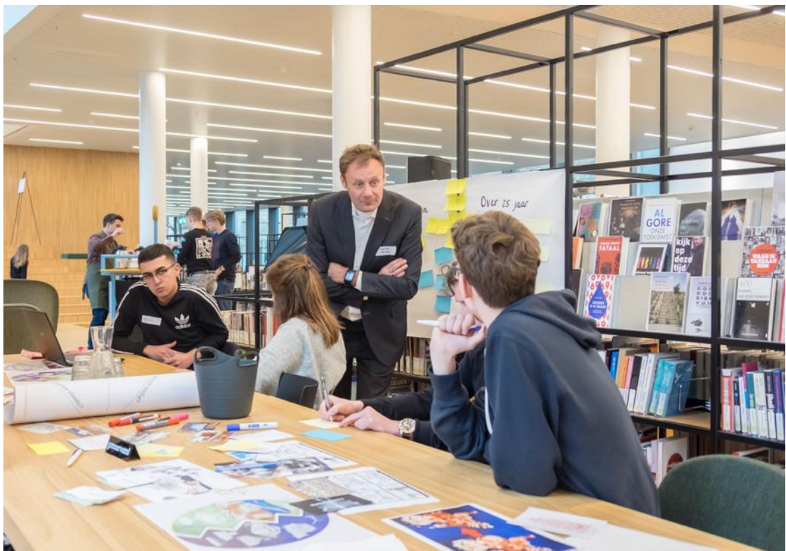
Samenwerken en kennisdelen

Wij hechten grote waarde aan diversiteit en werken volgens de Code Diversiteit en Inclusie. Wat dat concreet betekent gaan we verwerken in een actieplan.